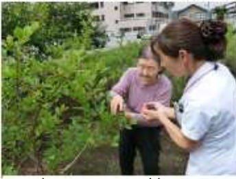
ブルーベリー摘み

土をいじり、苗を植え、育て、成長を観察し、食べる事で入所者の笑顔が見たい。昨年に引き続きホームでは園芸療法に取り組んでいます。昨年より植える種類も増えました。トマト・きゅうり・すいか・パッションフルーツ等を入所者よりアドバイスを頂きながら一緒に植えました。今から収穫を楽しみにしています。