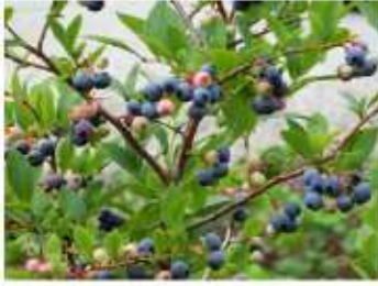
今年もブルーベリーは豊作