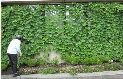
グリーンカーテン