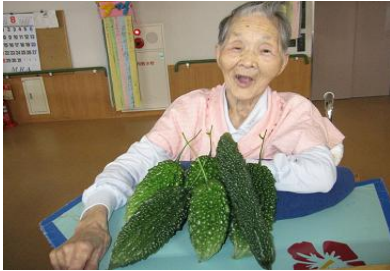
ゴーヤ収穫しました