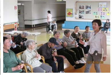
唄に合わせて楽器で演奏！中々の出来栄え